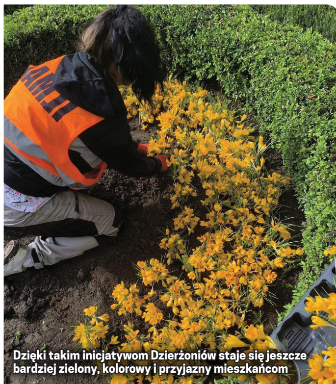
Dzięki takim inicjatywom Dzierżoniów staje się jeszcze bardziej zielony, kolorowy i przyjazny mieszkańcom