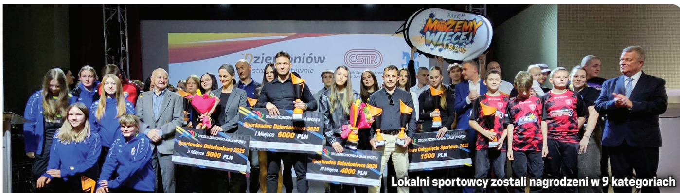
Lokalni sportowcy zostali nagrodzeni w 9 kategoriach

kandydatów miał każdy mieszkaniec Dzierżoniowa, a także kluby, organizacje i związki sportowe. Najwięcej, bo aż 27 zgłoszeń, wpłynęło na sportowca roku.