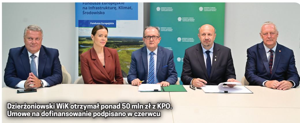
Dzierżoniowski WiK otrzymał ponad 50 mln zł z KPO. Umowę na dofinansowanie podpisano w czerwcu