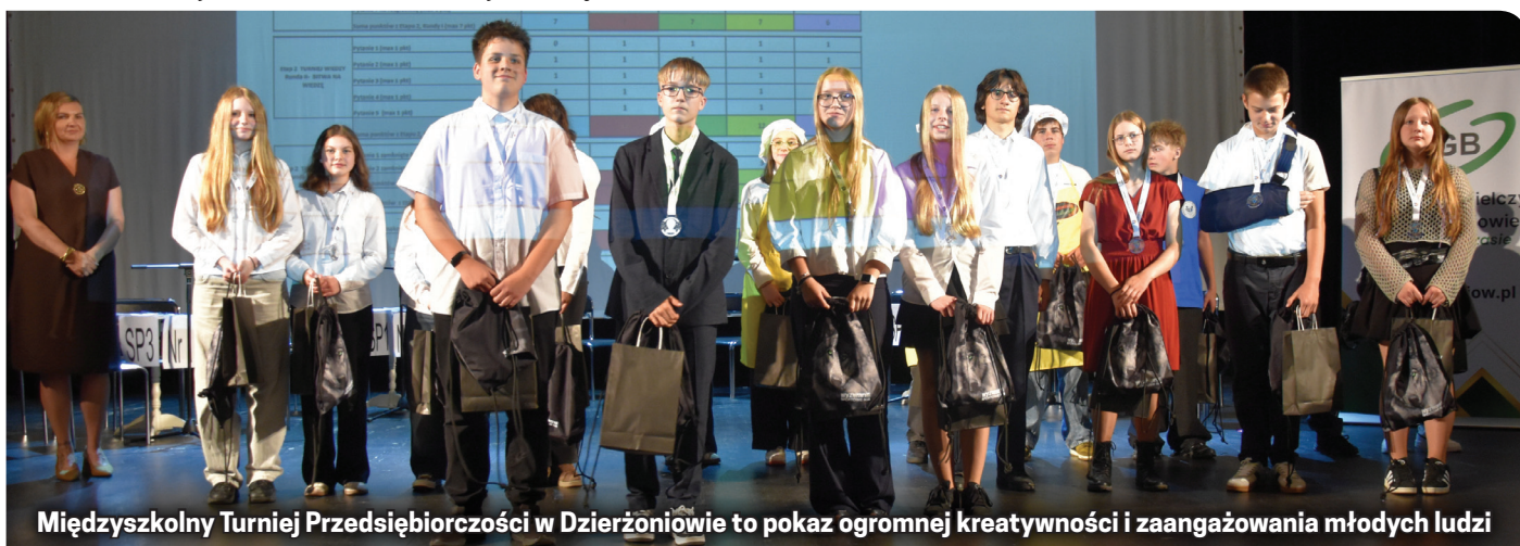
Międzyszkolny Turniej Przedsiębiorczości w Dzierżoniowie to pokaz ogromnej kreatywności i zaangażowania młodych ludzi

Organizatorem całego przedsięwzięcia było miasto Dzierżoniów, a partnerem strategicznym Bank Spółdzielczy w Dzierżoniowie. Dziękujemy wszystkim lokalnym przedsiębiorcom za otwartość i chęć dzielenia się wiedzą. A młodym uczestnikom wczorajszego finału gratulujemy świetnych pomysłów.