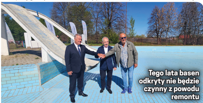
Tego lata basen odkryty nie będzie czynny z powodu remontu