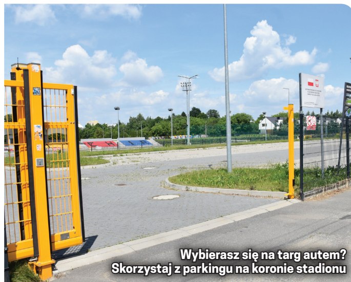
Wybierasz się na targ autem? Skorzystaj z parkingu na koronie stadionu

Nowy parking na koronie stadionu przy ul. Wrocławskiej jest w całości wybrukowany, co gwarantuje czystość i komfort niezależnie od warunków pogodowych. Szeroki, bezkolizyjny dojazd od strony ulicy Wrocławskiej eliminuje problem korków i niebezpiecznego manewrowania w ciasnych uliczkach. Podobnie jak dotychczas, korzystanie z nowego parkingu pozostaje w 100% darmowe.