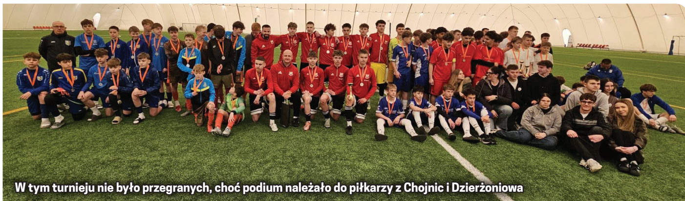
W tym turnieju nie było przegranych, choć podium należało do piłkarzy z Chojnic i Dzierżoniowa

zależnie od zajętego miejsca – otrzymali pamiątkowe medale, a najlepsze zespoły dodatkowo wzbogaciły się o okazałe puchary. Na twarzach zawodników gościł przede wszystkim uśmiech, a duch fair play i międzynarodowej przyjaźni towarzyszył rywalizacji od pierwszego do ostatniego gwizdka.