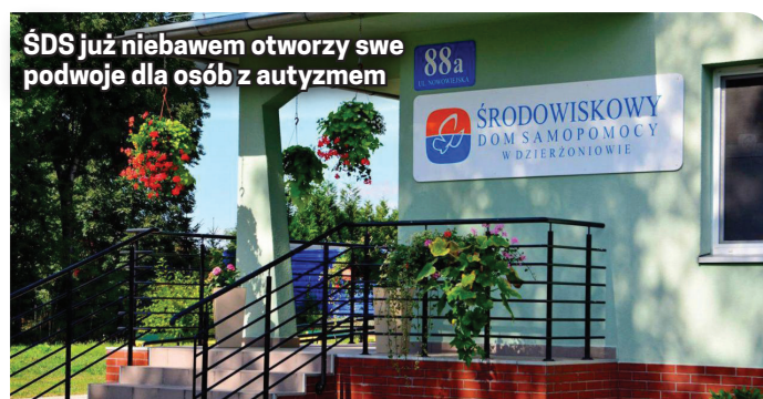
ŚDS już niebawem otworzy swe podwoje dla osób z autyzmem

Placówka funkcjonuje od poniedziałku do piątku w godzinach od 7.00 do 15.00.