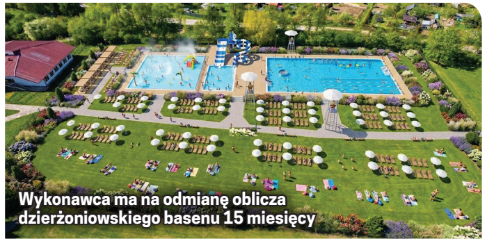
Wykonawca ma na odmianę oblicza dzierżoniowskiego basenu 15 miesięcy

konstrukcjami ze stali nierdzewnej. Powstanie kompleks rekreacyjno-pływacki o powierzchni ok. 900 m 2 , łączący funkcje sportowe z atrakcjami wodnymi;