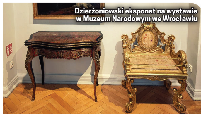
Dzierżoniowski eksponat na wystawie w Muzeum Narodowym we Wrocławiu

bytkowych sprzętów z czasów historyzmu przybliżyła tę małą znaną epokę i przedstawiała jej intrygujące oblicze. Wystawa poświęcona była głównie meblarstwu drugiej połowy XIX i początku XX w. Ukazywała najważniejsze nurty inspirowa-