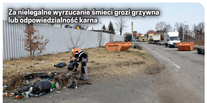
Za nielegalne wyrzucanie śmieci grozi grzywna lub odpowiedzialność karna

Jeśli znacie Państwo lokalizacje, w których podzucane są odpady, prosimy o kontakt ze Strażą Miejską Dzierżoniowa, tel. 74 645 08 88, 533 650 044.