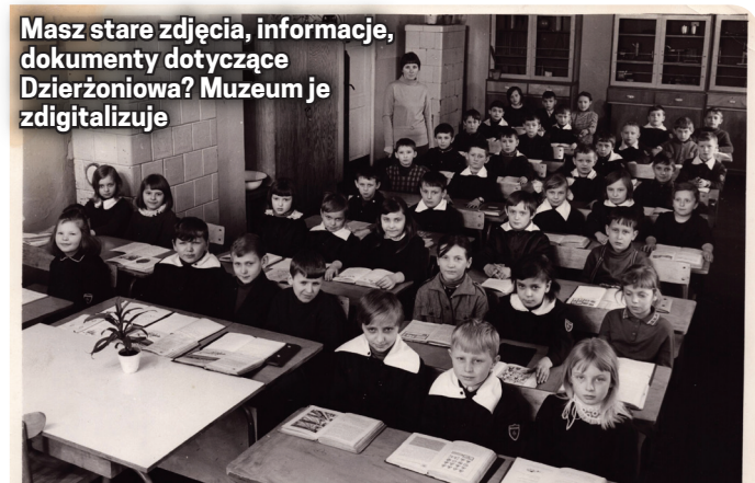
SZKOŁA PODSTAWOWA Nr 6 w DZIERŻONIOWIE Klasa III rok szk. 1970/71

Masz stare zdjęcia, informacje, dokumenty dotyczące Dzierżoniowa? Muzeum je zdigitalizuje