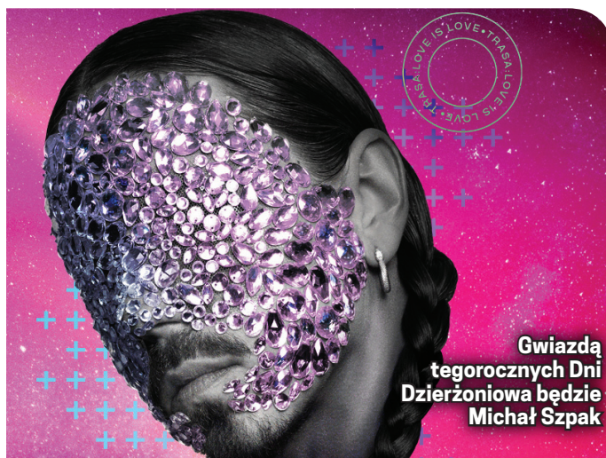
Gwiazdą tegorocznych Dni Dzierżoniowa będzie Michał Szpak