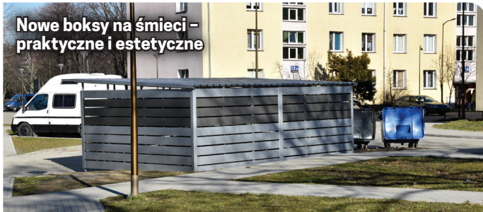
Nowe boksy na śmieci – praktyczne i estetyczne

W ostatnim czasie na osiedlu stanęły nowe boksy na śmieci. Miejsce gromadzenia odpadów jest wyłożone kost-