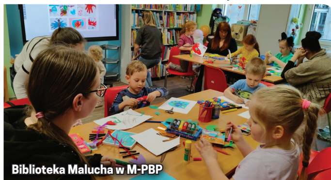
Biblioteka Malucha w M-PBP

15 kwietnia, 20 maja, 17 czerwca, godz. 16.00 - zajęcia dla dzieci w wieku 7-12 lat, zapisy pod nr tel. 507 770 859, koszt: 10 zł. Dział Dziecięcy filii M-PBP (budynek SP1).