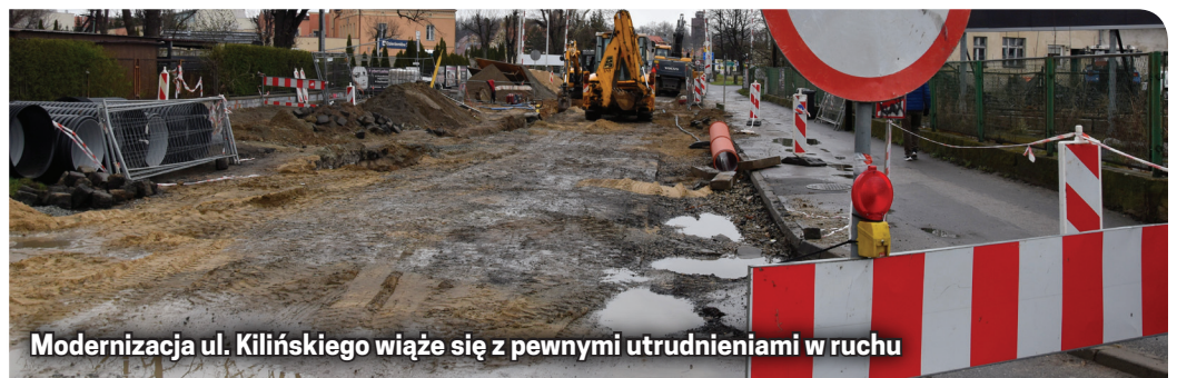
Modernizacja ul. Kilińskiego wiąże się z pewnymi utrudnieniami w ruchu

O poszczególnych etapach inwestycji i wiążących się z nimi zmianami w organizacji ruchu będziemy Państwa informować w osobnych komunikatach.