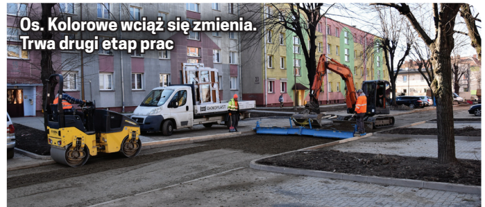
Os. Kolorowe wciąż się zmienia. Trwa drugi etap prac

ką betonową, na której postawiono konstrukcje z płyt ażurowych.