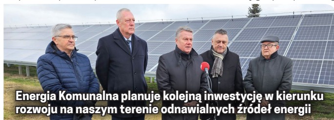
Energia Komunalna planuje kolejną inwestycję w kierunku rozwoju na naszym terenie odnawialnych źródeł energii

Klastra Energii. Fotowoltaika wraz z istniejącą biogazownią w Łagiewnikach o mocy elektrycznej 700 kW i elektrociepłownią na zrębki drzewne