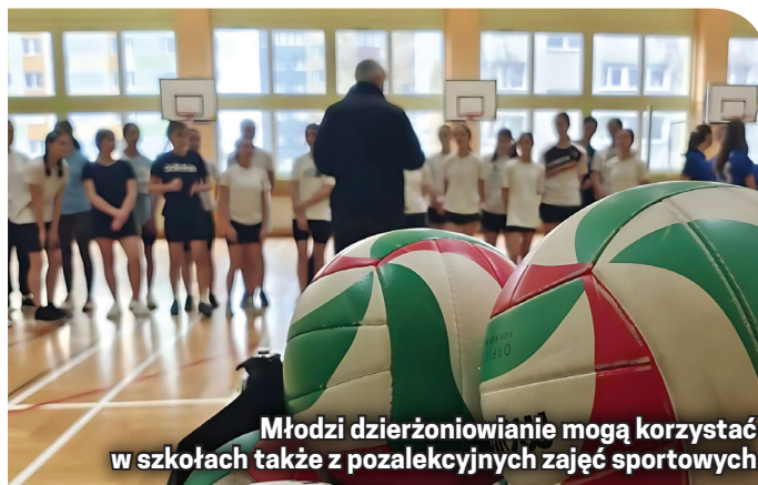
Młodzi dzierżoniowianie mogą korzystać w szkołach także z pozalekcyjnych zajęć sportowych

W ramach zajęć, które w Dzierżoniowie będą realizowane do końca listopada, prowadzone są treningi piłki ręcznej i zajęcia ogólnorozwojowe.