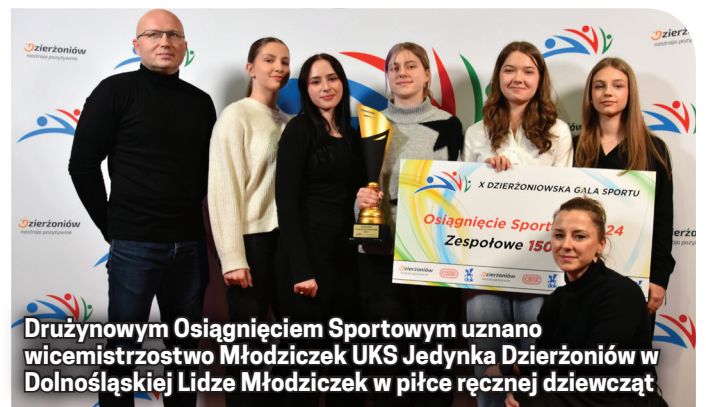
Drużynowym Osiągnięciem Sportowym uznano wicemistrzostwo Młodziczek UKS Jedynka Dzierżoniów w Dolnośląskiej Lidze Młodziczek w piłce ręcznej dziewcząt

Młodziczki UKS Jedynka Dzierżoniów (piłka ręczna) - wicemistrzyni Dolnośląskiej