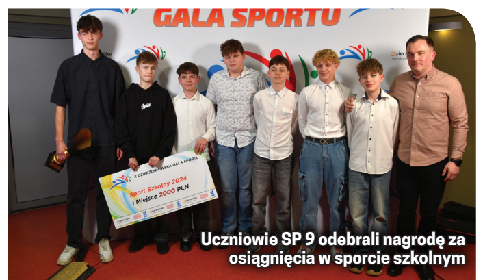
Uczniowie SP 9 odebrali nagrodę za osiągnięcia w sporcie szkolnym