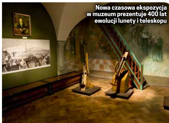
Nowa czasowa ekspozycja w muzeum prezentuje 400 lat ewolucji lunety i teleskopu

Wernisaż wystawy 19 lutego o godz. 17.00. Zapraszamy, wstęp wolny.