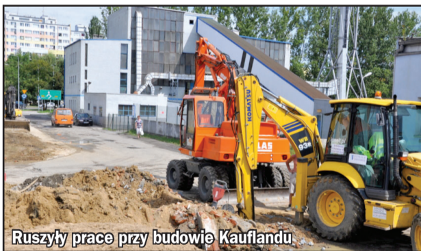
Ruszyły prace przy budowie Kauflandu

handlowy stanowi problem wyłącznie dla równie dużych konkurentów. Rywalizacja cenowa najsilniej rozgrywa się wśród małych i średnich dyskontów spożywczych. Ich powstanie, patrząc z perspektywy ostatnich dziesięciu lat, nie wpłynęło znacząco na liczbę funkcjonujących w mieście małych sklepów spożywczych. Co dziś oznacza powstanie w Dzierżonowie kolejnych obiektów