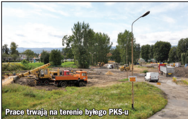
Prace trwają na terenie byłego PKS-u

W niedalekiej przyszłości kolejny obiekt handlowy wybudowany zostanie przy skrzyżowaniu ul. Bielawskiej i Piastowskiej. Również w tym przypadku prywatny inwestor na własny koszt wybuduje tu rondo. To także warunek, bez spełnienia którego realizacja tej inwestycji nie będzie możliwa. Jak dużo nowych sklepów może jeszcze powstać w Dzierżonowie? Szukając dużych i wolnych terenów pod takie inwestycje wydaje się, że na tym koniec. Z drugiej strony inwestujące w naszym mieście firmy handlowe podkreślają wciąż wysoki potencjał. Spowodowany jest on głównie rozwojem miasta oraz faktem, że na zakupy do Dzierżonowa często przyjeżdżają już nie tylko mieszkańcy powiatu. Kilka, może kilkanaście lat temu powstanie dużych obiektów handlowych powodowało wyraźną reakcję lokalnych kupców. Dziś wydaje się, że kolejny market