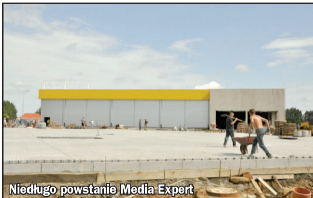
Niedługo powstanie Media Expert