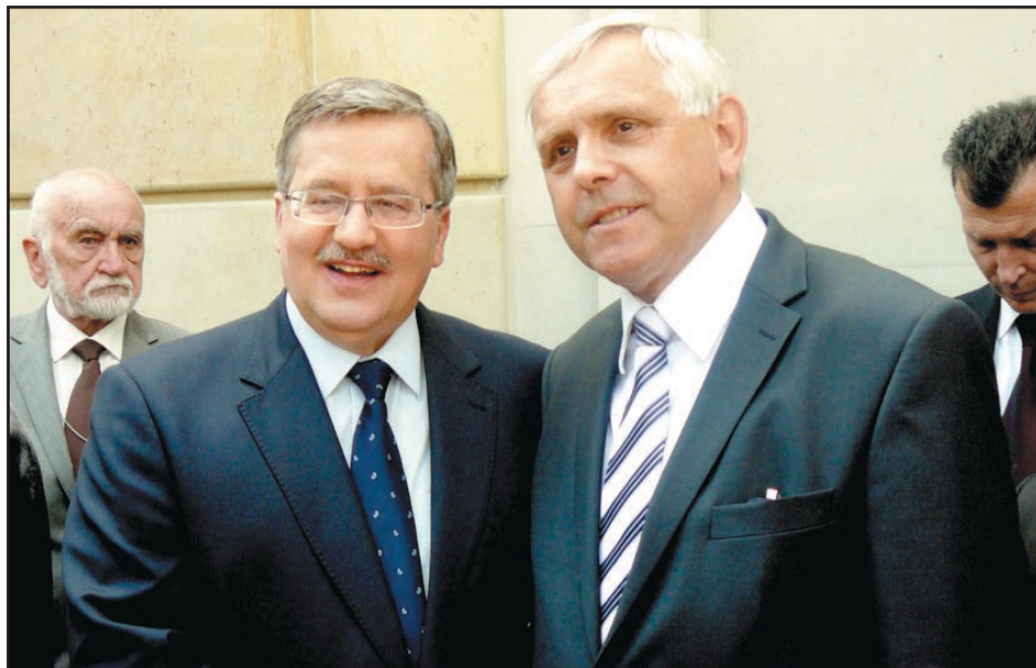
Prezydent Rzeczypospolitej Polskiej Bronisław Komorowski i burmistrz Dzierżoniowa Marek Piorun w czasie spotkania z okazji Dnia Samorządu Terytorialnego

– Święto samorządu to dzień triumfu wspaniałej, mądrej idei, która przeorała polską rzeczywistość i budowała nowe możliwości – powiedział prezydent Bronisław Komorowski na spotkaniu z samorządowcami. W ogrodach Pałacu Prezydenckiego z okazji „Dnia Samorządu Terytorialnego” prezydent Bronisław Komorowski odznaczył zasłużonych samorządowców. Prezydent powiedział także, że doszło do porozumienia między rządem a samorządowcami w sprawie ograniczenia deficytu. – W ramach Komisji Wspólnej Rządu i Samorządu udało się