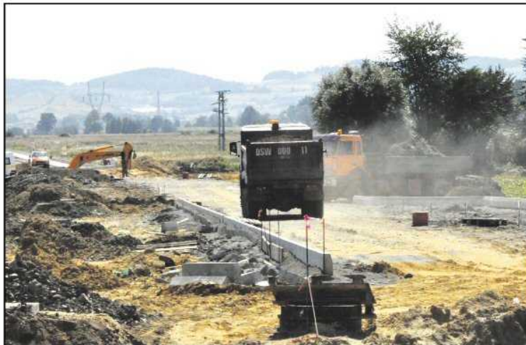
Każda z realizowanych przez miasto inwestycji ma swój początek w Wieloletnim Planie Inwestycyjnym

- Coroczne pytanie i sprawdzenie potrzeb inwestycyjnych jest elementem aktualizacji jednego ze strategicznych dla rozwoju miasta dokumentów. Wieloletni Plan Inwestycyjny Dzierżoniowa określa, jakie zadania i w jakim czasie będą realizowane - mówi zastępca burmistrza Wanda Ostrowska. Aktualizacja WPI rozpoczyna się od zebrania propozycji mieszkańców, radnych, organizacji społecznych, wspólnot mieszkaniowych i tych wypracowanych przez urząd. Następnie każde z zadań poddawane jest analizie i ocenie według jednolitych kryteriów. Uzyskany wynik ma wpływ na termin realizacji zadania. W obowią-