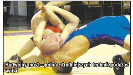
Podwójny most – jedna z trudniejszych technik podczas walki