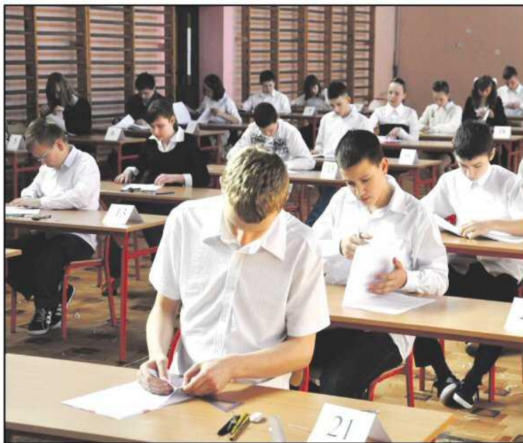
Szóstoklasiści ze Szkoły Podstawowej nr 3 na chwilę przed rozpoczęciem pierwszego ważnego egzaminu

Umiejętności te mają charakter ponadprzedmiotowy. Oznacza, że np. czy-