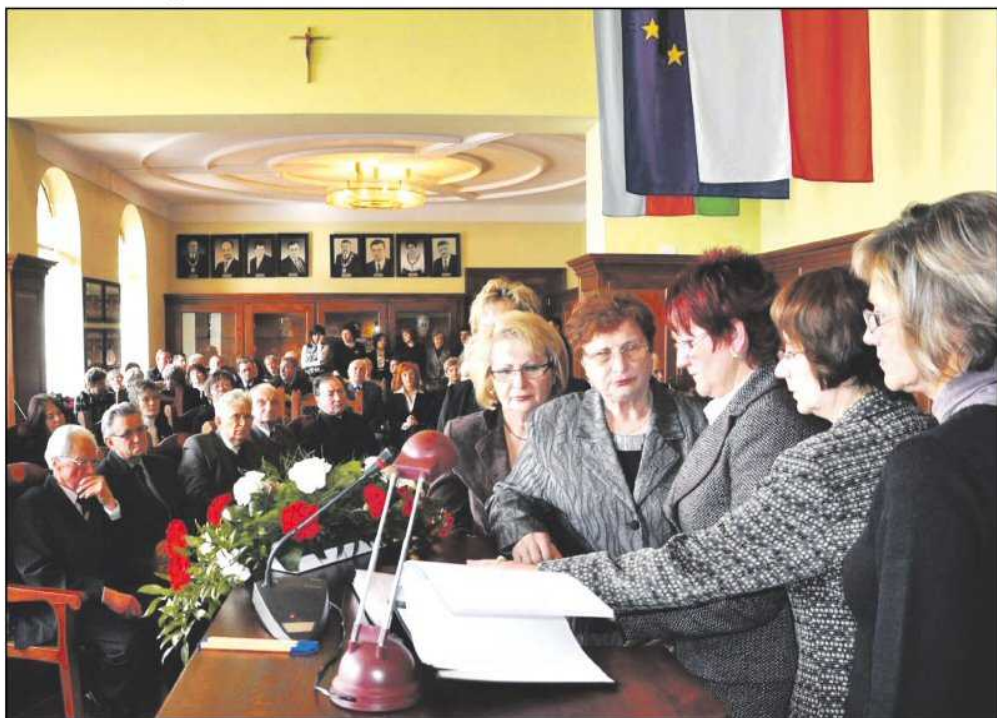
Mieszkańcy Dzierżoniowa i przedstawiciele instytucji samorządowych wpisują się do książki kondolencyjnej upamiętniającej ofiary katastrofy pod Smoleńskiem

Przejmująca cisza i skupienie panowały w trakcie nadzwyczajnej sesji, zwołanej na wniosek burmistrza w celu upamiętnienia ofiar ofiary katastrofy, do której doszło 10 kwietnia.