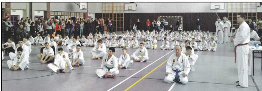
Egzamin na stopnie szkoleniowe