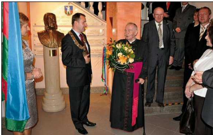
Akt nadania tytułu Honorowego Obywatela Dzierżoniowa wręczono podczas kwietniowej sesji Rady Miejskiej