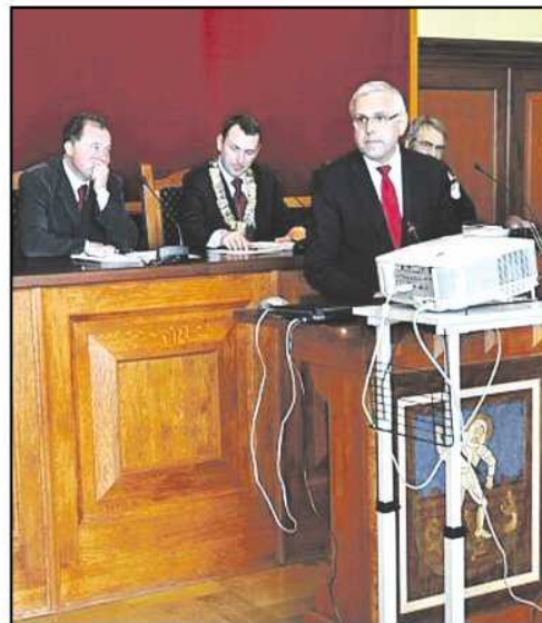
Burmistrz Dzierżoniowa dziękuje osobom zaangażowanym w realizację ubiegłorocznego budżetu, który w znacznym stopniu wspomagany był pieniędzmi pozyskanymi z Unii Europejskiej

Podczas kwietniowej sesji radni przyjęli także uchwały o obwodach i okręgach wyborczych. Ich wcześniejsze podjęcie było konieczne ze względu na przyspieszone wybory prezydenckie oraz tegoroczne wybory samorządowe. Na zakończenie obrad radnym przedstawiono sprawozdanie z realizacji Programu Współpracy z Miastami Partnerskimi, Programu Współpracy z Organizacjami Pozarządowymi oraz sprawozdanie z pracy burmistrza. Pełna treść podjętych uchwał wraz z uzasadnieniami dostępna jest na stronie www.dzierzonow.pl