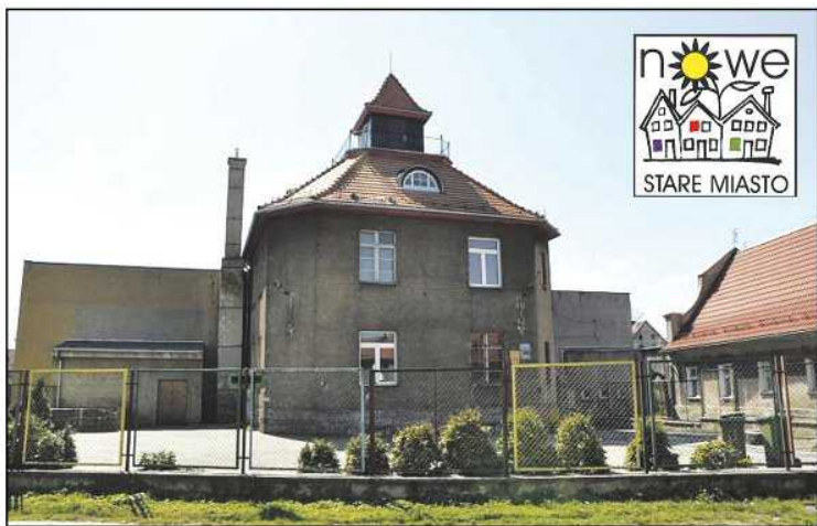
Na gruntowny remont budynku, w którym mieści się siedziba TPD miasto pozyskało 900 tys. zł

Budynek, w którym mieści się Towarzystwo Przyjaciół Dzieci oraz Punkt Interwencji Kryzysowej, w ciągu najbliższych miesięcy przejdzie gruntowny remont. Roboty budowlane obejmą przebudowę pomieszczeń i dostosowanie ich do potrzeb osób niepełnosprawnych, wykonanie nowych instalacji wewnętrznych, kompleksową termomodernizację, wymianę okien, przebudowę instalacji centralnego ogrzewania i wykonanie nowej elewacji budynku. Gruntowny remont przejdzie także przylegająca do obiektu sala gimnastyczna. Prace przy ul. Nowowiejskiej kosztować