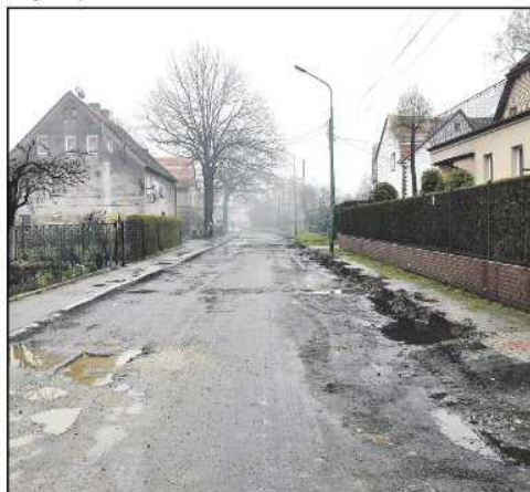
Na modernizację ulicy Brzegowej miasto zdobyło ponad 4 mln zł dofinansowania z Unii Europejskiej

starej nawierzchni pomiędzy ul. Zachodnią a terenami dzierżoniowskiej podstrefy. Przebudowa tej drogi realizowana jest w oparciu o pozyskane przez Dzierżoniów ponad 4 miliony złotych. Kolejny etap prac, w efekcie których Brzegowa zyska nową nawierzchnię, chodniki, oświetlenie, kanalizację deszczową i zatoki autobusowe, obejmie odcinek od strony ul. Kilińskiego. Tu roboty budowlane rozpoczną się na przełomie lipca i sierpnia.