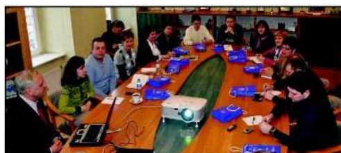
W piątek 15 stycznia Dzierżonów gościł przedstawicieli rosyjskich organizacji pozarządowych oraz państwowej i samorządowej administracji

Najwięcej czasu poświęcono informacji i przekazaniu szczegółów związanych z realizacją przez Dzierżonów autorskiego programu oświatowego wspomagającego rozwój zainteresowań uczniów „Každy może zostać Omnibusem” oraz wyrównującego szanse edukacyjne programu „Nauka to wyzwanie mamy na to rozwiązanie”. Dzierżonów ma już wieloletnią tradycję współpracy z wschodnimi sąsiadami. Nasze miasto wielokrotnie odwiedzali przedstawiciele