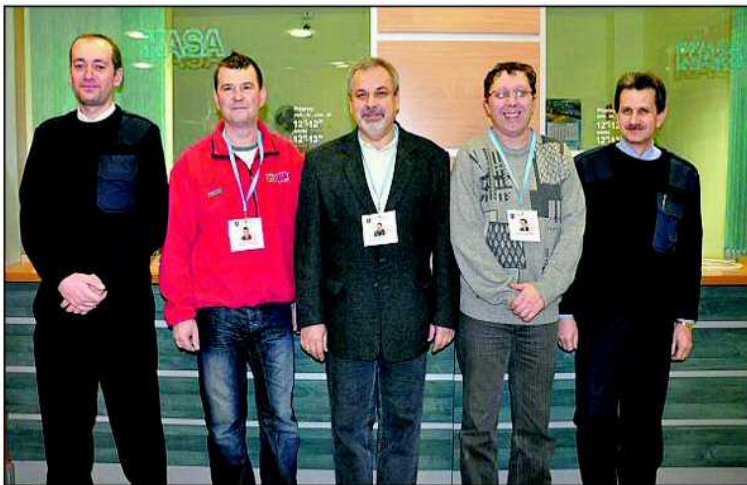
Zajmujący się dostarczeniem decyzji podatkowych doręczyciele nie pobierają opłat

By przyspieszyć przekazywanie 12 tysięcy decyzji, miasto, podobnie jak w minionym roku, zatrudniło dodatkowych doręczycieli. Osoby, które do końca lutego będą odwiedzać mieszkańców, posiadają specjalne, imienne identyfikatory z aktualną fotografią i co ważne, nie pobierają opłat gotówkowych. Podatek od nieruchomości można uregulować w czterech ratach: do 15 marca, 15 maja, 15 września i 15 listopada. Przypominamy również, że opłaty za wieczyste użytkowanie gruntu należy uregulować bez wezwania