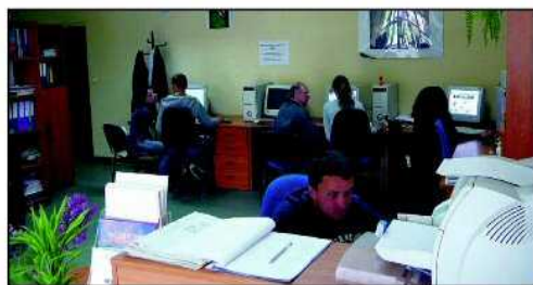
W siedzibie GCI można uzyskać szczegółowe informacje dotyczące pozyskiwania pieniędzy z unijnych funduszy

Operacyjnych. Pracownicy punktu będą przeprowadzać wstępną diagnozę, wykazującą, czy pomysły klientów na przedsięwzięcia mają szansę na uzyskanie dofinansowania, wskazać ewentualne źródła dofinansowania oraz przedstawiać podstawowy zakres i przebieg unijnych procedur. Informacje dla mieszkańców Dzierżonowa i powiatu udzielane są telefonicznie, z wykorzystaniem poczty elektronicznej i osobiście. Działalność „Punktu Informacyjnego Funduszy Europejskich” finansowana jest ze środków