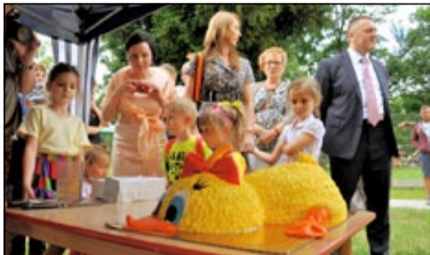
Po bogatym programie artystycznym na zebranych czekała jeszcze jedna atrakcja – tort w kształcie kaczki dziwaczki