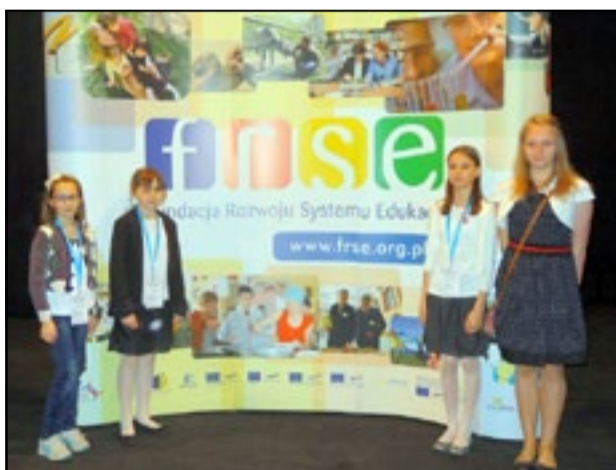
Blog projektu SP 9 w języku polskim można śledzić pod adresem http://thegeniuslog.blogspot.com