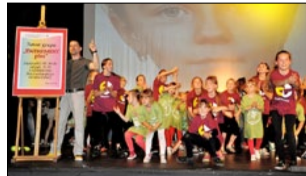
Zapraszamy do obejrzenia galerii zdjęć z jubileuszem 10-lecia zespołów „Ewenement” na www.dzierzonow.pl

Zarówno najmłodszy z „Ewenementu”, jak i nieco starsi z „Małego Ewenementu” oraz „stara gwardia” z „Ewenementu” przygotowali dla widzów – rodzin, znajomych i współpracujących z nimi zespołów tanecznych – wiele atrakcji. Najpierw niekoniecznie tradycyjną roztańczoną opowieść o Czerwonym Kapturku, a potem taneczną retrospekcję – wybór układów z ostatniej dekady. A było tego sporo. Każdy jednak inny, zaskakujący i dynamiczny.