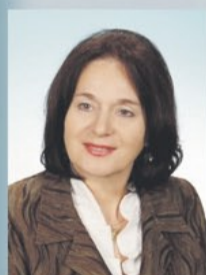
Wanda Kunecka Przewodnicząca Komisji Edukacji i Spraw Społecznych