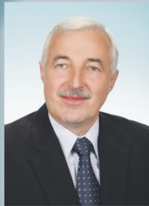
Przewodniczący Rady Miejskiej Andrzej Wiczkowski