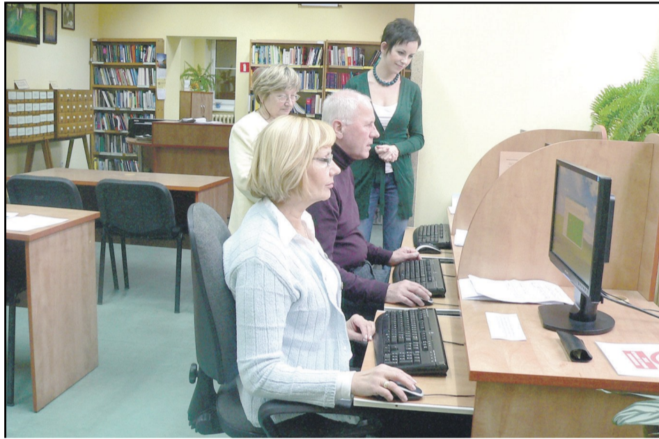
Pracownicy dzierżoniowskiej biblioteki zdradzają tajniki obsługi komputera i korzystania z Internetu

W czasie specjalnych warsztatów starszym mieszkańcom objaśniane są zasady działania programów do edycji tekstu, obsługi poczty elektronicznej oraz sposoby wyszukiwania informacji w Internecie. Oferta biblioteki kierowana jest do osób, które skończyły 50 lat. Zajęcia odbywają się raz w tygodniu, w grupie liczącej do ośmiu osób. Mieszkańców Dzierżoniowa, którzy nie mieli wcześniej kontaktu z komputerami i Internetem zapewniamy, że nauka podstaw jest łatwa, a przyjemność z korzystania oferowanych dzięki Internetowi możliwości ogromna. Pierwszy kurs potrwa do połowy stycznia. Pod koniec stycznia pracownicy