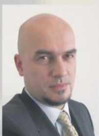
Jarosław Kresa Przewodniczący Klubu Radnych Porozumienie Dzierżonowskie