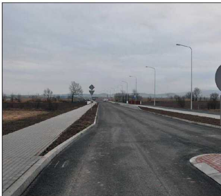
Budowa nowego odcinka ulicy Strefowej umożliwia dalszy rozwój gospodarczy miasta