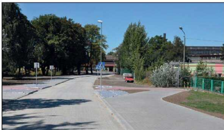
Nowy odcinek ul. Parkowej łączy ul. Piłsudskiego ze Świdnicką

wana w tym roku inwestycja dotyczyła budowy ul. Polnej, która zyskała nawierzchnię z kostki betonowej i nową infrastrukturę drogową. Na wszystkie realizowane w tym roku prace, dzięki którym w Dziernżonowie budowane są drogi i chodniki oraz na prace projektowe związane z przygotowaniem kolejnych inwestycji drogowych miasto przeznaczyło ponad 13 mln zł.