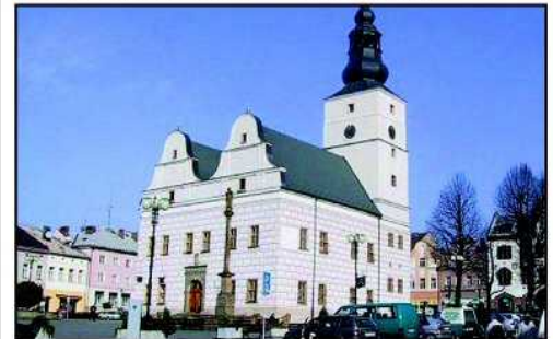
Znakomite połączenie gór i jeziora czyni Lanškroun przepiękną miejscowością. Na zdjęciu Ratusz w Lanškroun

Heights. Decyzję o formalnym nawiązaniu partnerstwa podjęli dzierżoniowscy radni podczas lutowej sesji. Village of Harwood Heights to niewielkie miasto położone niedaleko Chicago. Mieszka w nim wiele osób polskiego pochodzenia, związanych także z Dzierżonowem. Propozycja współpracy wypłynęła ze strony amerykańskiej. Szczegóły dotyczące Village of Harwood Heights można znaleźć na stronie http://www.harwoodheights.org . Partnerami Dzierżonowa są dziś ponadto Serock i Kluczbork (Polska), Bischofsheim (Niemcy), Crew and Nantwich (Wielka Brytania).