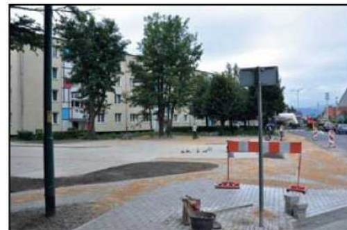
Każdego roku miasto buduje i remontuje istniejące parkingi zwiększając wciąż niewystarczającą liczbę miejsc do parkowania