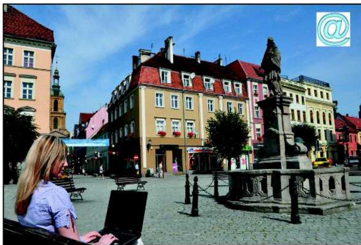
Darmowy dostęp do Internetu ma służyć mieszkańcom i turystom odwiedzającym centrum miasta

Użytkownicy komputerów, palmtopów czy telefonów komórkowych bez ponoszenia opłat z łatwością uzyskają dostęp do sieci www. Zasięg pierwszego darmowego internetu w Dzierżonowie obejmuje Rynek oraz część ulicy Wrocławskiej, Świdnickiej, Krasickiego i Żąbkowickiej. Prędkość, z jaką można surfować, nie jest może w tej chwili imponująca, ale bez wątplenia wystarczy, by w miarę szybko sprawdzić interesujące nas informacje czy odebrać maila. Oferta miasta będzie z czasem ulepszana. Dzierżonów będzie zwiększał prędkość łącza, ale taki dostęp do sieci nie zastąpi usług komercyjnych. Bez-