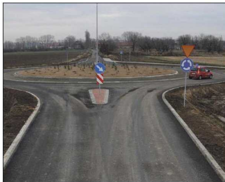
Oprócz ronda na ul. Strefowej bezpieczne skrzyżowanie powstało także przy wyjeździe z os. Jasnego