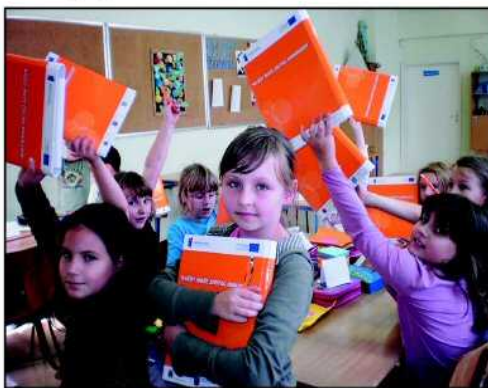
Uczestnicy „Klubów Omnibusa” bezpłatnie otrzymują pomoce ułatwiające naukę

kolejności rekrutacją objęto tych uczniów, których rodzice nie mogą pozwolić sobie na dodatkowe zajęcia dla dzieci. Głównym celem trzyletniego programu jest nauka języków obcych, stosowanie nabywanych umiejętności w praktyce i poznanie najnowszych programów komputerowych. Dzieci i młodzież uczą się także zasad pracy w zespole i sposobów rozwiązywania