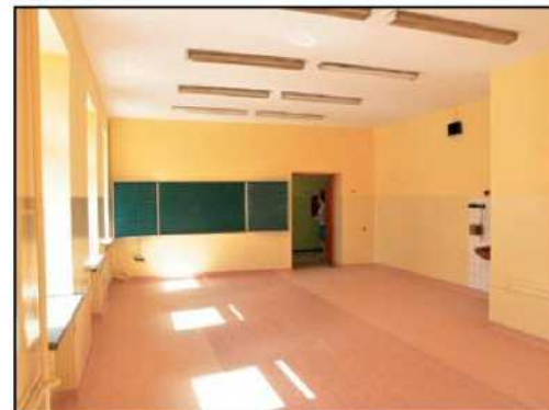
Wyremontowane klasy w Szkole Podstawowej nr 3. Na inwestycję w oświacie miasto przeznaczyło w tym roku 1,5 mln zł