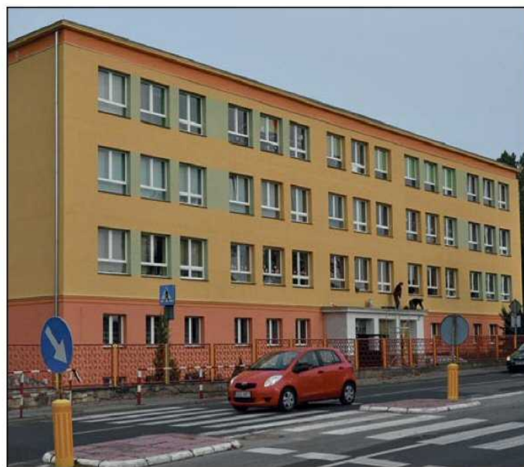
Budynek przy ul. Wrocławskiej to kolejna placówka oświaty z odnowioną elewacją