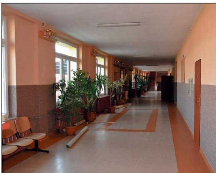
Wykonanie nowych posadzek zakończyło cykl remontów w Szkole Podstawowej nr 9