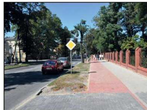
Nowe chodniki przy ul. Świdnickiej, Daszyńskiego i Piastowskiej to najbardziej widoczne tegoroczne inwestycje