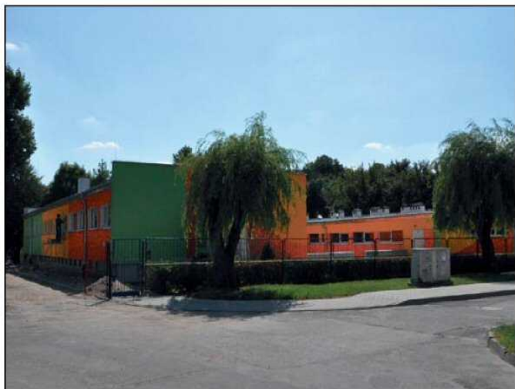
Kolorowo, nowocześnie i oszczędnie. Nowa elewacja żłobka i kolektory słoneczne pozwolą na oszczędności w ogrzewaniu