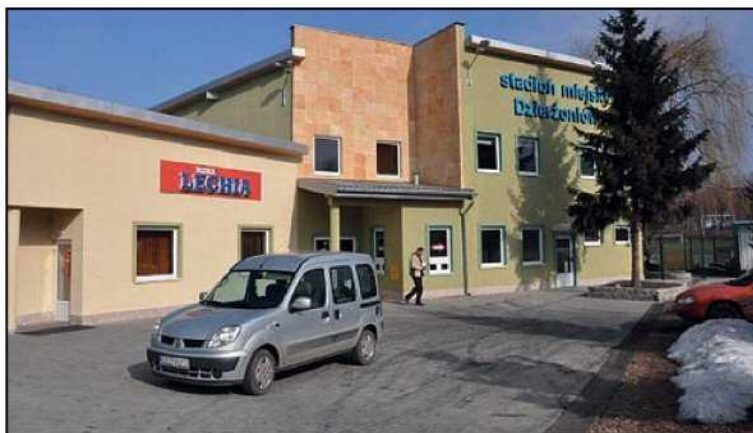
W tym roku powstało nowoczesne zaplecze sportowe Lechii, kolejnym krokiem będzie modernizacja stadionu

Budowa nowej drogi w podstrefie ma strategiczne znaczenie dla rozwoju gospodarczego miasta. Kosztujące 5 mln zł zadanie sfinansowano dzięki pozyskaniu z „Narodowego Programu Przebudowy Dróg Lokalnych” 2,5 mln zł. Wybudowany odcinek ul. Strefowej umożliwia także nowy dojazd do miasta i podstrefy, a przy okazji zwiększa znacznie długość ścieżek rowerowych w Dziernżonowie.