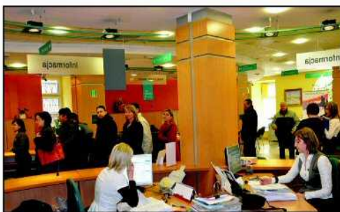
W ramach programu doskonalenia jakości usług publicznych w urzędach za unijne pieniądze podnoszona będzie jakość usług świadczonych przez jednostki samorządu terytorialnego. Na zdjęciu Biuro Obsługi Klienta dzierżoniowskiego urzędu

korzyścią Dzierżoniowa będzie zdobycie doświadczeń i możliwość finansowanych przez Unię Europejską szkoleń, koniecznych przy ubieganiu się miasta o najwyższy poziom Europejskiej Nagrody Jakości. Dążenie miasta do stosowania najlepszych technik zarządzania i pracy na najwyższym poziomie bardzo ułatwi promocję Dzierżoniowa na europejską skalę. Na realizowane wspólnie przez 27 dolnośląskich i Małopolskich samorządów zadania Dzierżoniów pozyskał 6 mln zł.