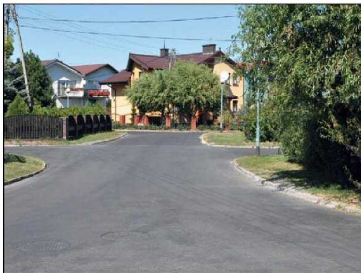
Na wszystkich ulicach na os. Młodych ułożono nową nawierzchnię