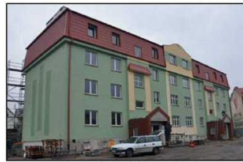
W tym roku do użytku oddano 2 budynki TBS-u, w kolejnych latach powstaną następne

W grudniu pierwsi lokatorzy zamieszkali w nowym budynku TBS-u, przy ul. Kopernika. To już drugi budynek TBS-u wybudowany w tym roku. Zainteresowanie usługami budownictwa społecznego jest u nas wciąż spore, dlatego w najbliższych planach jest budowa kolejnych TBS-ów.