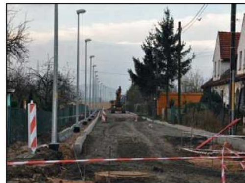
Ul. Polna to przykład niewielkiej, ale najważniejszej z punktu widzenia jej mieszkańców inwestycji