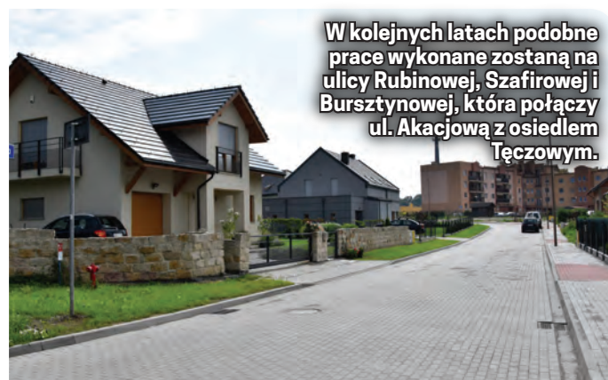
W kolejnych latach podobne prace wykonane zostaną na ulicy Rubinowej, Szafirowej i Bursztynowej, która połączy ul. Akacją z osiedlem Tęczowym.

o długości prawie 200 metrów wyłożono kostką betonową. Prace budowlane kosztowały 304 tys. zł. Wykonana je w terminie wyłoniona w drodze przetargu dzierżoniowskie Przedsiębiorstwo Wielobranżowe „Baza”.