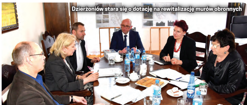
Dzierżoniów stara się o dotację na rewitalizację murów obronnych

w sposób bezpośredni i praktyczny. Ponadto wspiera wymianę wiedzy o środowisku pomiędzy nauką, gospodarką oraz innymi publicznymi i prywatnymi instytucjami. Jednym z elementów działalności fundacji jest także wpieranie działań polegających na zabezpieczeniu i restaurowaniu zabytków.