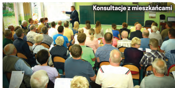
Konsultacje z mieszkańcami

czeństwo. Zgłoszone uwagi i opinie zostaną uwzględnione przy przebudowie ul. Szkolnej i 11 Listopada (odcinek od ul. Szkolnej, do ul. Kościuszki). Raz jeszcze dziękuję za udział mieszkańców w konsultacjach – mówi burmistrz