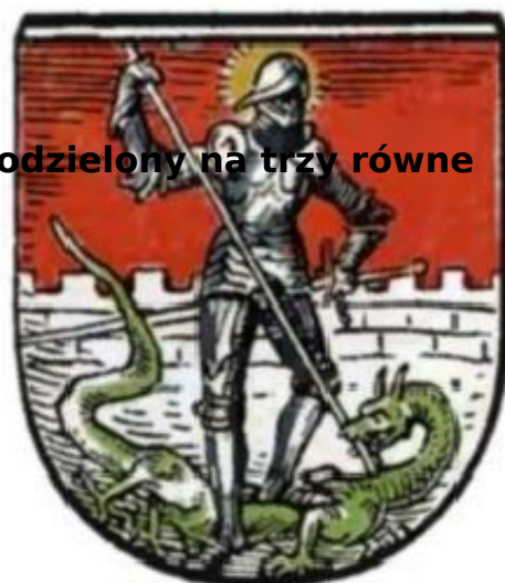
Herb Dzierżoniowa (Reichenbach) z 1898 roku

Kolory znajdujące się na fladze, mają swoje odzwierciedlenie również w herbie.