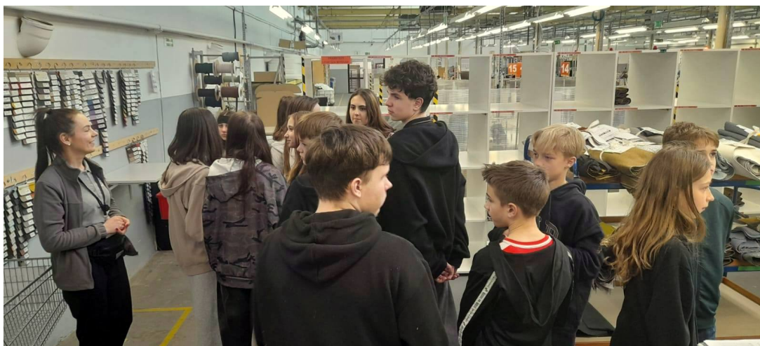
Uczniowie jednej ze szkół podstawowych z wizytą w firmie Zebra.

W 2025 r. dzięki zaangażowaniu dzierzoniowskich przedsiębiorców udało się zrealizować 64 lekcje przedsiębiorczości dla blisko 1.500 uczniów. Była to bezcenna szansa dla dzieci na zdobycie wiedzy praktycznej, poznanie realiów prowadzenia firmy oraz zainspirowanie się historiami lokalnych biznesów.