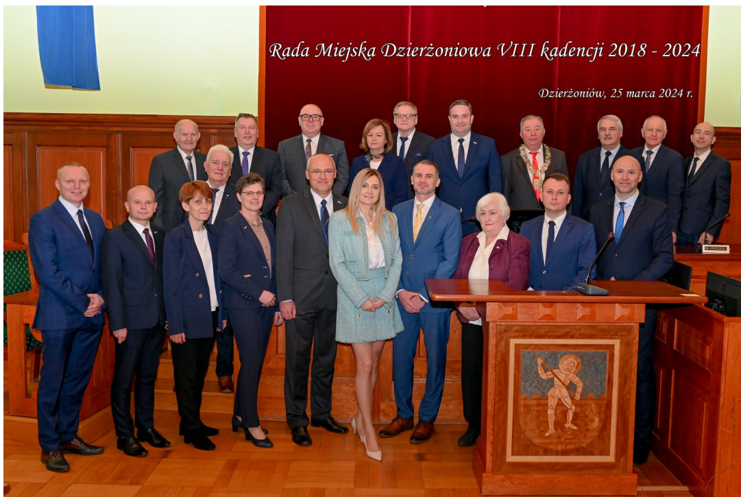
Dzierżoniowscy radni VIII kadencji.