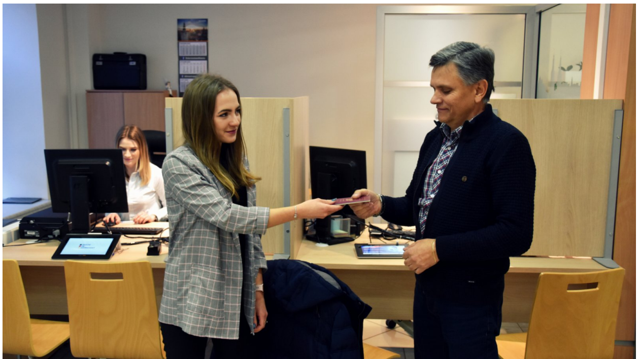
Fot. Terenowy Punkt Paszportowy funkcjonuje w dzierzoniowskim urzędzie od października 2022 r.

Wizytę można umówić wyłącznie poprzez rejestrację na stronie internetowej. Każda rejestracja dotyczy konkretnej, indywidualnej osoby.