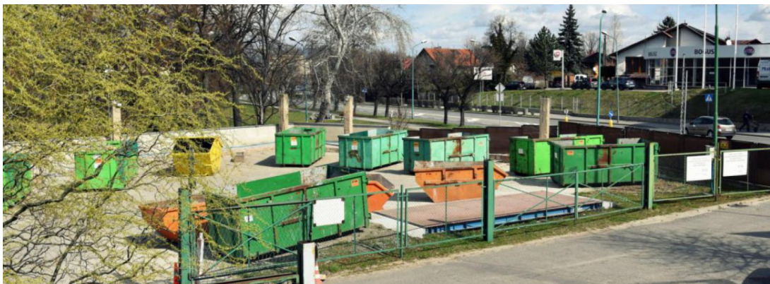
Punkt Selektywnego Zbierania Odpadów Komunalnych (PSZOK) znajduje się przy ul. Bielawskiej 15

PSZOK czynny jest 6 dni w tygodniu, od poniedziałku do soboty. Do punktu można dostarczyć bez dodatkowych opłat odpady komunalne z gospodarstw domowych, takie jak: meble oraz inne odpady wielkogabarytowe, odpady budowlano-remontowe (gruz bez zanieczyszczeń, płyty kartonowo-gipsowe, zużyty sprzęt elektryczny, odpady zielone (trawa, liście), przeterminowane leki, chemikalia i odpady niebezpieczne z gospodarstwa domowego (resztki farb, lakierów, klejów, rozpuszczalników, świetlówki i inne odpady zawierające rtęć, itp.), zużyte baterie i akumulatory, zużyte opony z pojazdów użytkowanych w gospodarstwie domowym oraz posegregowane odpady z papieru, szkła, metali, tworzyw sztucznych i wielomateriałowe.