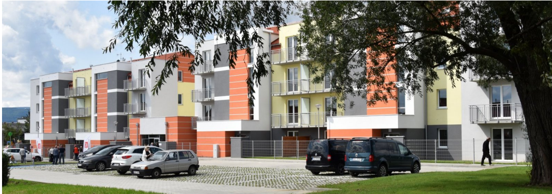
Dwa nowoczesne budynki komunalne przy ul. Prusa mają swoich lokatorów od sierpnia 2023 r. Pomiędzy blokami jest łącznik z miejscem na punkt usługowy

zmieniły się ich sytuacje rodzinne (najczęściej chodziło o powiększenie rodziny lub o osoby starsze). Naboru dokonano również spośród osób z list oczekujących na lokale mieszkalne oraz osób, które w przeszłości oddały lokale komunalne i zamieszkiwały w zasobie Dzierżoniowskiego Towarzystwa Budownictwa Społecznego Sp. z o.o., na podstawie porozumienia dotyczącego wynajmu lokali będących własnością DTBS Sp. z o.o. osobom wskazanym przez gminę (lokale w posiadaniu zależnym gminy).