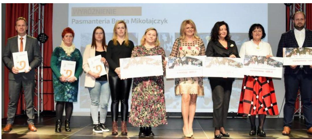
Laureaci konkursu na Najładniejszą Witrynę Świąteczną

Przyznano również 2 wyróżnienia w wysokości 400 zł, które otrzymali: