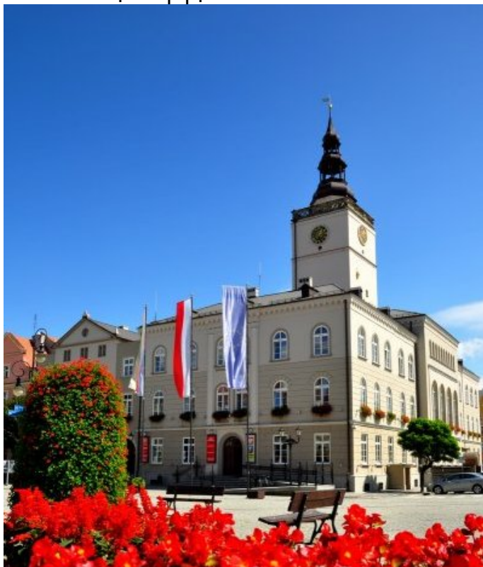
Odwiedzając Dzierżoniów i Centrum

Informacji Turystycznej można zwiedzić i wspiąć się na średniowieczną wieżę ratuszową. Zbudowana jest ona na planie kwadratu, do której wnętrza prowadzą dwa wejścia ozdobione ostrołukowymi ceglanyimi portalami.