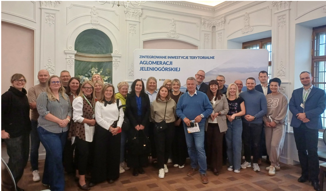
Wizyta studyjna ZIT POF w ZIT Aglomeracji Jeleniogórskiej.

W listopadzie 2025 r. do Zarządu Województwa Dolnośląskiego przedłożona została kolejna aktualizacja Strategii ZIT POF, umożliwiająca jednostkom samorządu terytorialnego skuteczne aplikowanie o środki w ramach Programu Fundusze Europejskie dla Dolnego Śląska 2021–2027 oraz zapewniająca ciągłość realizacji zaplanowanych projektów inwestycyjnych.