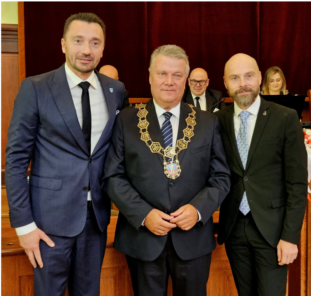
Burmistrzowie Serocka, Dzierżoniowa i Lanškroun.

Delegacja z Serocka odwiedziła Dzierżoniów także podczas Dni Dzierżoniowa oraz we wrześniu podczas oficjalnych uroczystości z okazji jubileuszu. Również we wrześniu w Serocku odbył się turniej piłkarski Twin Cities Cup w Jadwisinie młodzieży z rocznika 2014 i młodsi, w którym uczestniczyli młodzi piłkarze z Dzierżoniowa.