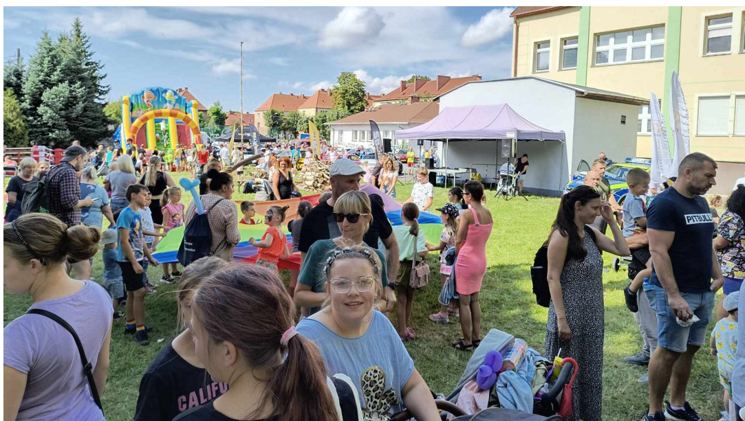
Piknik Rodzinny zorganizowany przez OPS i RC Monkeys.

Ośrodek Pomocy Społecznej realizuje własne i zlecone gminie zadania z zakresu pomocy społecznej, polegające w szczególności na prowadzeniu diagnostyki jednostkowej i środowiskowej, świadczeniu pracy socjalnej na rzecz rodzin wymagających wsparcia, ustalaniu uprawnień, przyznawaniu i wypłacaniu świadczeń przewidzianych ustawą o pomocy społecznej, realizacji rządowych programów pomocy społecznej i gminnych programów ośłonowych, aktywizowaniu środowiska lokalnego w zakresie działań dotyczących zaspokajania potrzeb pomocy społecznej, przyznawaniu i wypłacaniu dodatków mieszkaniowych, świadczeń rodzinnych, świadczeń z funduszu alimentacyjnego, stypendiów socjalnych i zasiłków szkolnych, wspieraniu rodzin przeżywających trudności w wypełnianiu funkcji opiekuńczo-wychowawczych oraz realizacji zadań z zakresu przeciwdziałania przemocy w ramach prowadzenia zespołu interdyscyplinarnego.