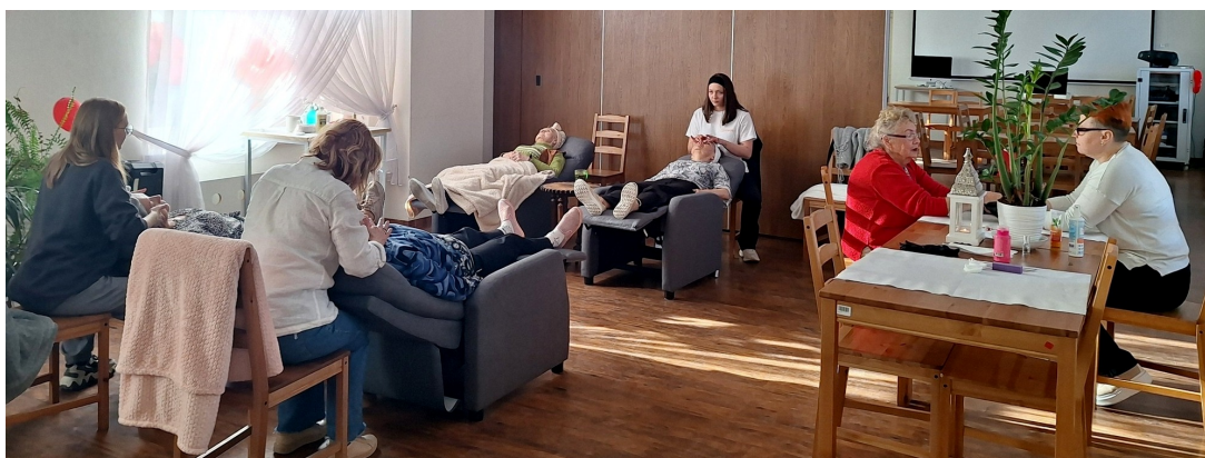
Uczestnicy Dziennego Domu Senior+ podczas zabiegów pielęgnacji twarzy.

Mogą również skorzystać z prania, prasowania oraz brać udział w imprezach kulturalno-oświatowych, wycieczkach turystyczno-krajoznawczych, wykładach, spotkaniach edukacyjnych, seansach w kinie oraz zajęciach na basenie, wyjazdach. Byli też gospodarzami akcji „Obudź się z Dziennym Domem-zajęcia z kijami”.