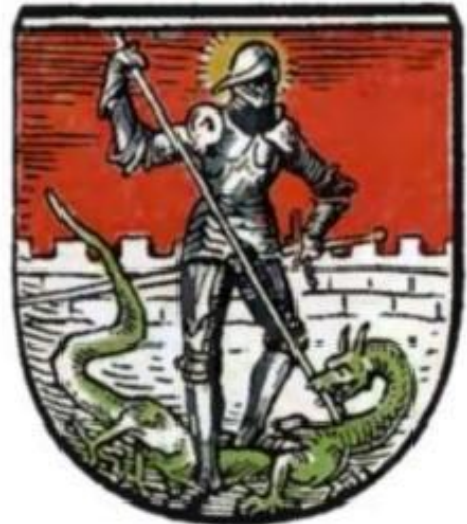
Herb Dzierżoniowa (Reichenbach) z 1898 roku