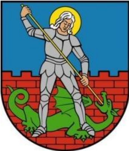
Współczesny herb Dzierżoniowa

Herb przedstawia wizerunek św. Jerzego (patrona miasta) zabijającego włócznią smoka. W tle widać mury miejskie.